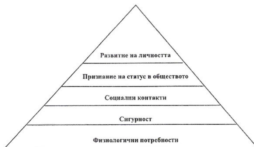
Пирамида на Маслоу за човешките потребности

От посочените от Маслоу потребности усещането за принадлежност е особено важно за образователните изследвания. Изследванията ясно показват, че един от решаващите фактори за успеха в образованието е чувството за принадлежност, а чувството за принадлежност отдавна се смята за важен компонент на образованието.